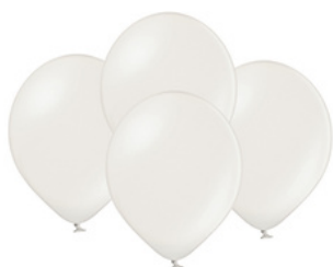
89-01 metalizowane 100 szt. 89-21 metalizowane 50 szt.