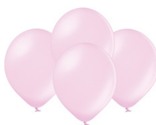
89-18 metalizowane 100 szt. 89-38 metalizowane 50 szt.