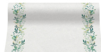
76-11 bieżnik 0,40x24m