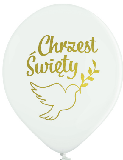
43-41 6 szt. rozmiar 12'