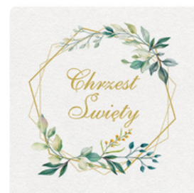
76-09 serwetki 40x40