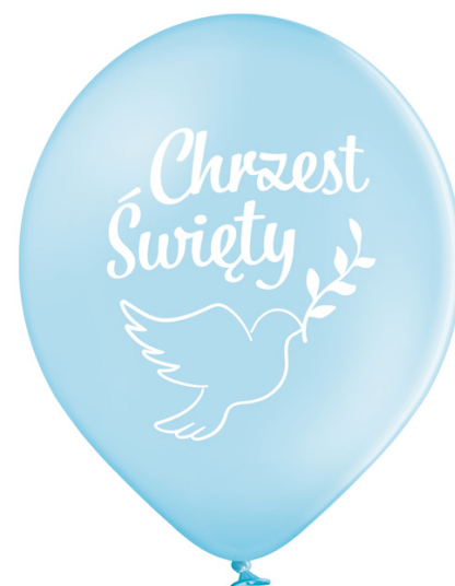
43-43 6 szt. rozmiar 12'