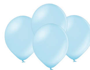
89-11 metalizowane 100 szt. 89-31 metalizowane 50 szt.