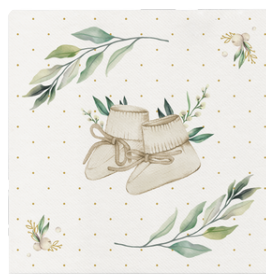
76-12 serwetki 40x40