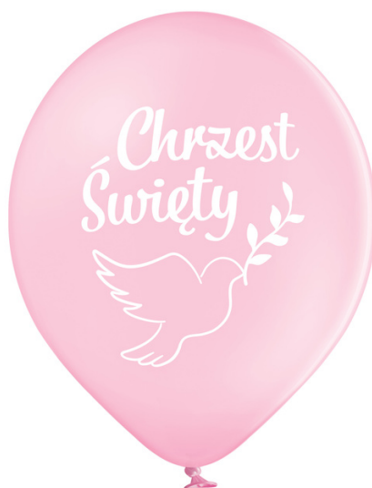
43-42 6 szt. rozmiar 12'