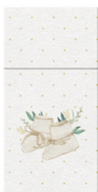
76-13 kieszonki do sztuców