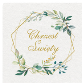
76-0, serwetki 33x33